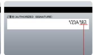
セキュリティコード