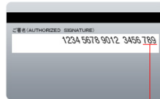
セキュリティコード